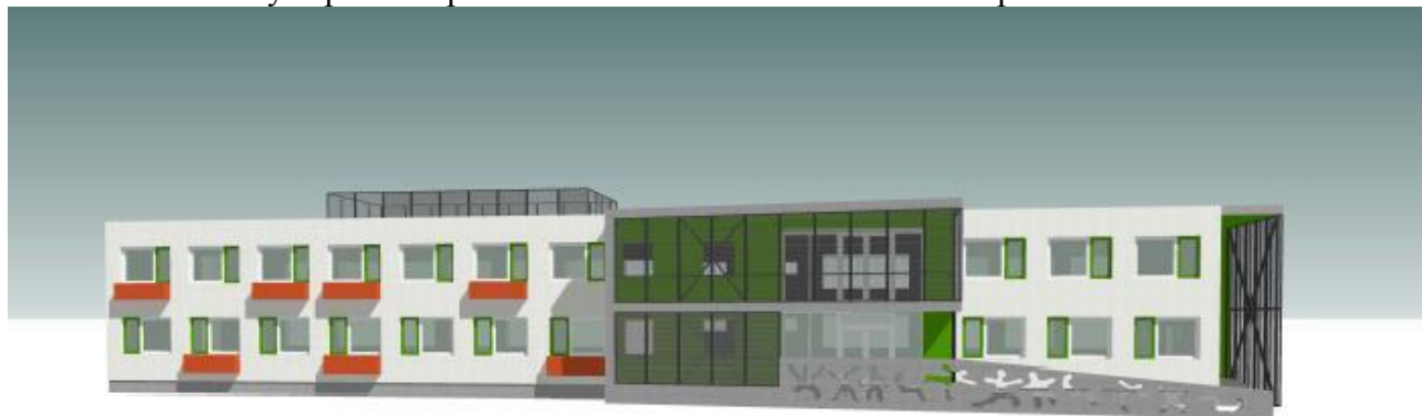
Studie přestavby objektu na ulici ČSA 262