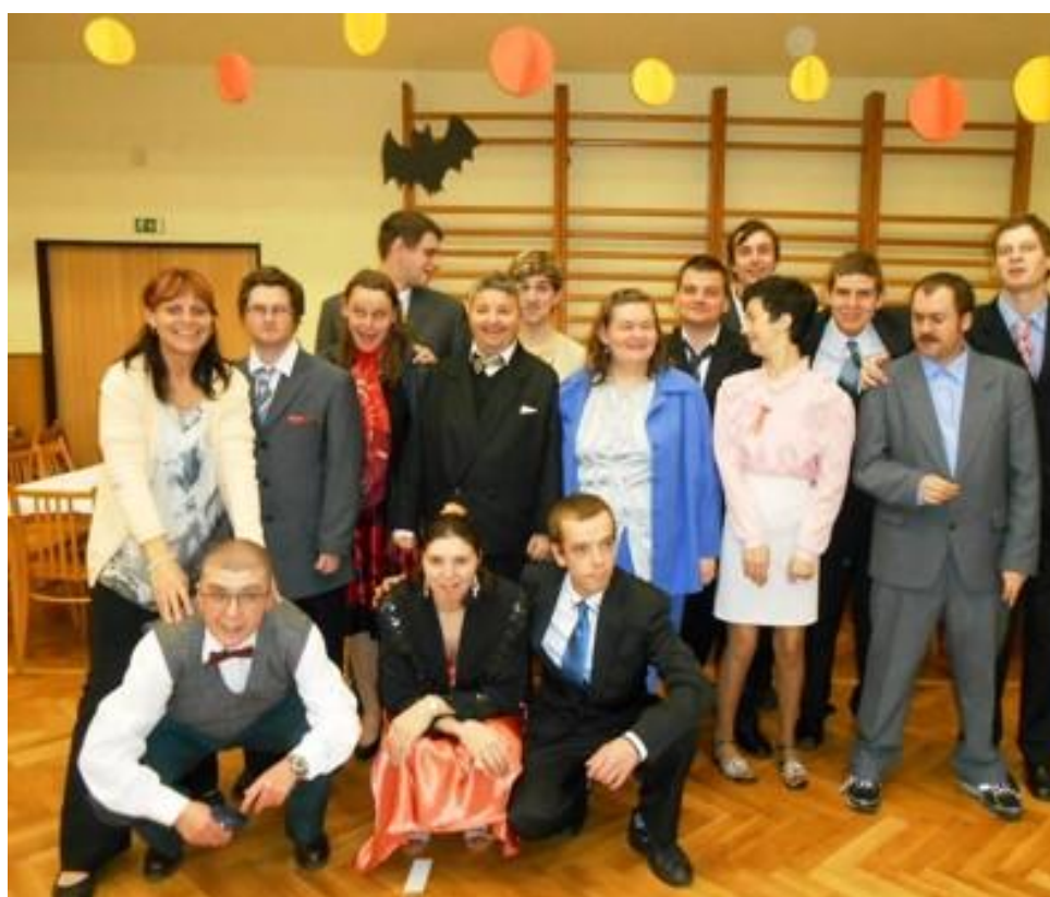
Stacionář Ústí nad Orlicí